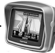
Rider 400, 5, 2, Pro, Urban